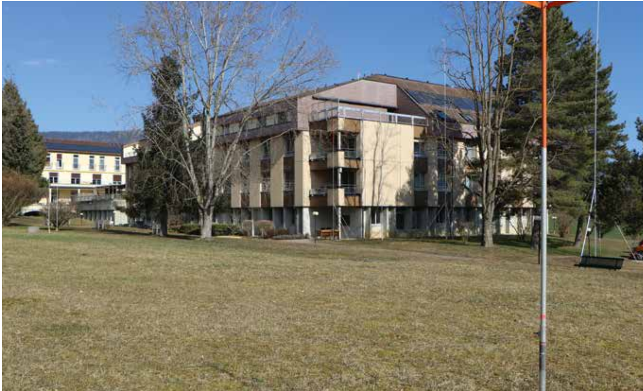
Les gabarits sont posés et l'aspect visuel du site va changer.

Le projet d'agrandissement, et aussi de rénovation du bâtiment actuel, de l'EMS de Landeyeux est sur les rails. La mise à l'enquête publique n'a entraîné aucune opposition. La pose de la première pierre est programmée pour le mois de novembre.