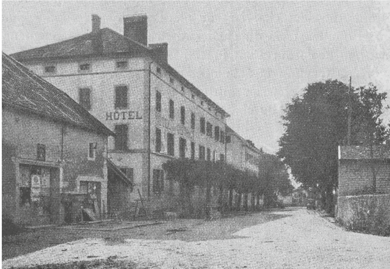
Fontaines, ancien hôtel du district.