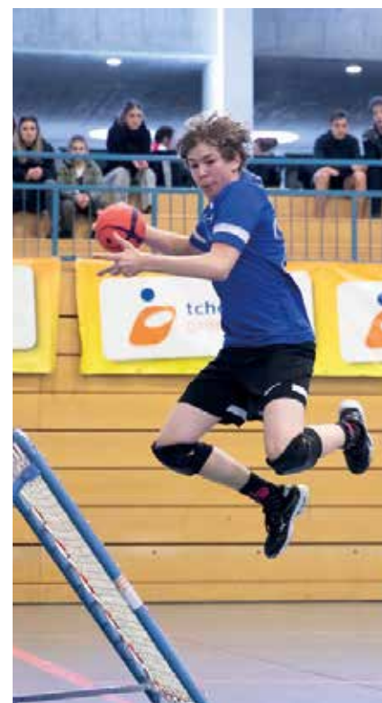
Les Val-de-Ruz Flyers ont survolé leur quart de finale de la Coupe de Suisse face aux Geneva Young Dragons.

Vainqueur du trophée lors de l'exercice 2022 – 2023, les Val-de-Ruz Flyers ont été éliminés pour la deuxième année consécutive par les Geneva Dragons en demi-finale de la Coupe de Suisse, le 8 mars à Meyrin. Ils ont perdu sur le score sans appel de trois sets à zéro (21-17 21-15 21-17). Le club de tchoukball vaudruzien s'est consolé en remportant la petite finale contre Lausanne Olympic 3-1 (25-23 21-19 17-21 21-19). Au cours de cette même journée, la relève des Val-de-Ruz Flyers a buté sur les jeunes des Geneva Dragons, en finale du Championnat de Suisse des moins de 16 ans, sur le score de 55-38.