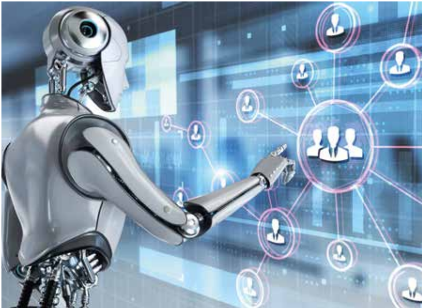
L'intelligence artificielle: un passage inévitable selon Rapid Rise.

Rapid Rise, c'est le nom de l'entreprise fondée l'an dernier à Chézard-Saint-Martin. Objectif de ses deux associés: améliorer l'efficacité des tâches administratives de petites sociétés avec l'appui de l'intelligence artificielle.