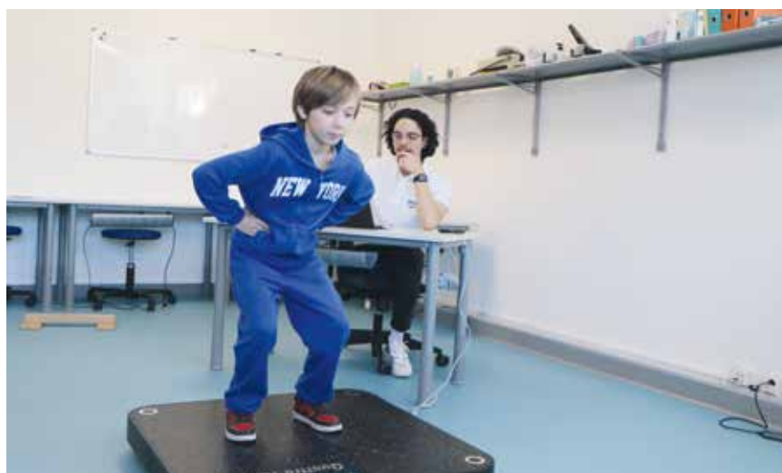
Un atelier permettait de tester sa force explosive grâce à un appareil de pointe (photo pif).

Ce centre avait obtenu le label Swiss Olympic en janvier 2023. Il est destiné aussi bien aux athlètes de pointe qu'aux amateurs, soucieux