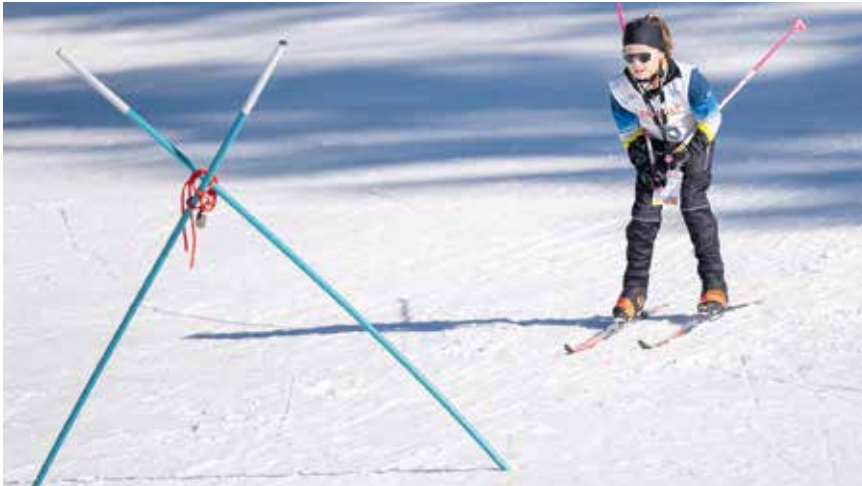
Un gymkhana au storio nordix games.