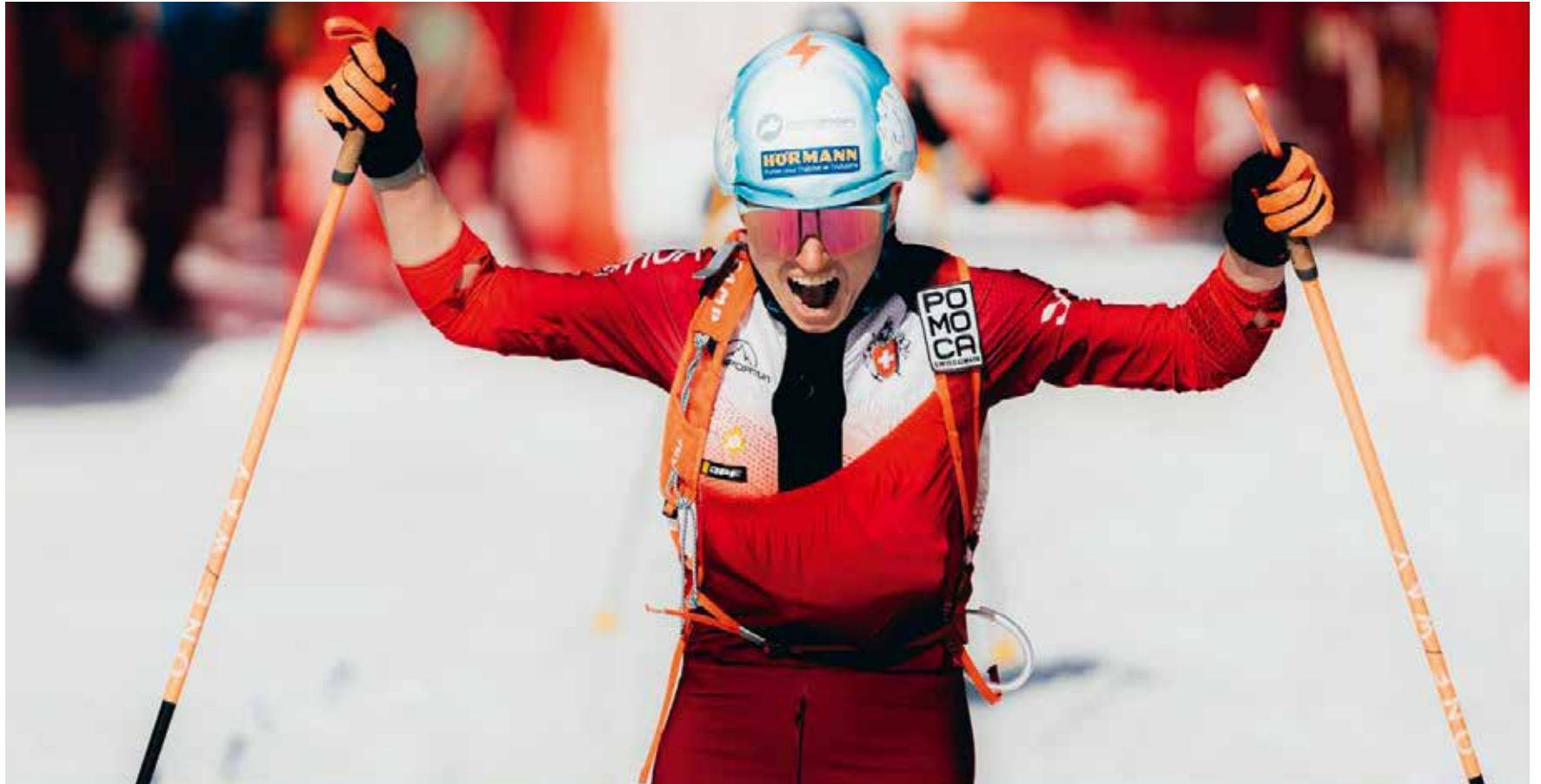
Le Graal pour Marianne Fatton. L'athlète de Dombresson est championne du monde de ski-alpinisme.