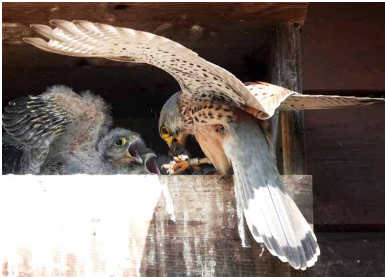
Nourrissage de juvéniles à Chézard-Saint-Martin.

La nidification des faucons crécerelles et chouettes effraies fait l'objet d'un suivi actif à Val-de-Ruz de la part d'un groupe de bénévoles qui ne demande qu'à s'agrandir. Friands de rongeurs, ces deux espèces de rapaces ont été classées comme «potentiellement menacées» après une forte baisse des couples nicheurs entre 1980 et 1990, dans notre pays.