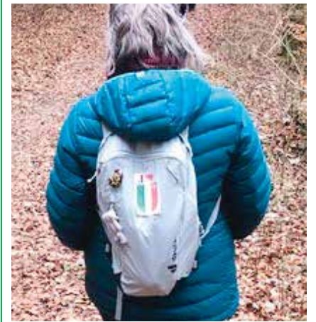
Ah, l'attachement à sa République.

La 40 e édition de la Marche commémorative du 1 er mars a connu une participation record: les organisateurs ont enregistré au total 2'250 inscriptions au départ du Locle, de La Chaux-de-Fonds et de Môtiers. Cette édition anniversaire s'est déroulée par une température bien hivernale et s'est conclue comme à l'accoutumée au Château de Neuchâtel. Mais ses organisateurs avaient réservé une surprise aux marcheurs sous la forme d'une animation visuelle, un spectacle son et lumière projeté sur la façade ouest de la Collégiale. /pif