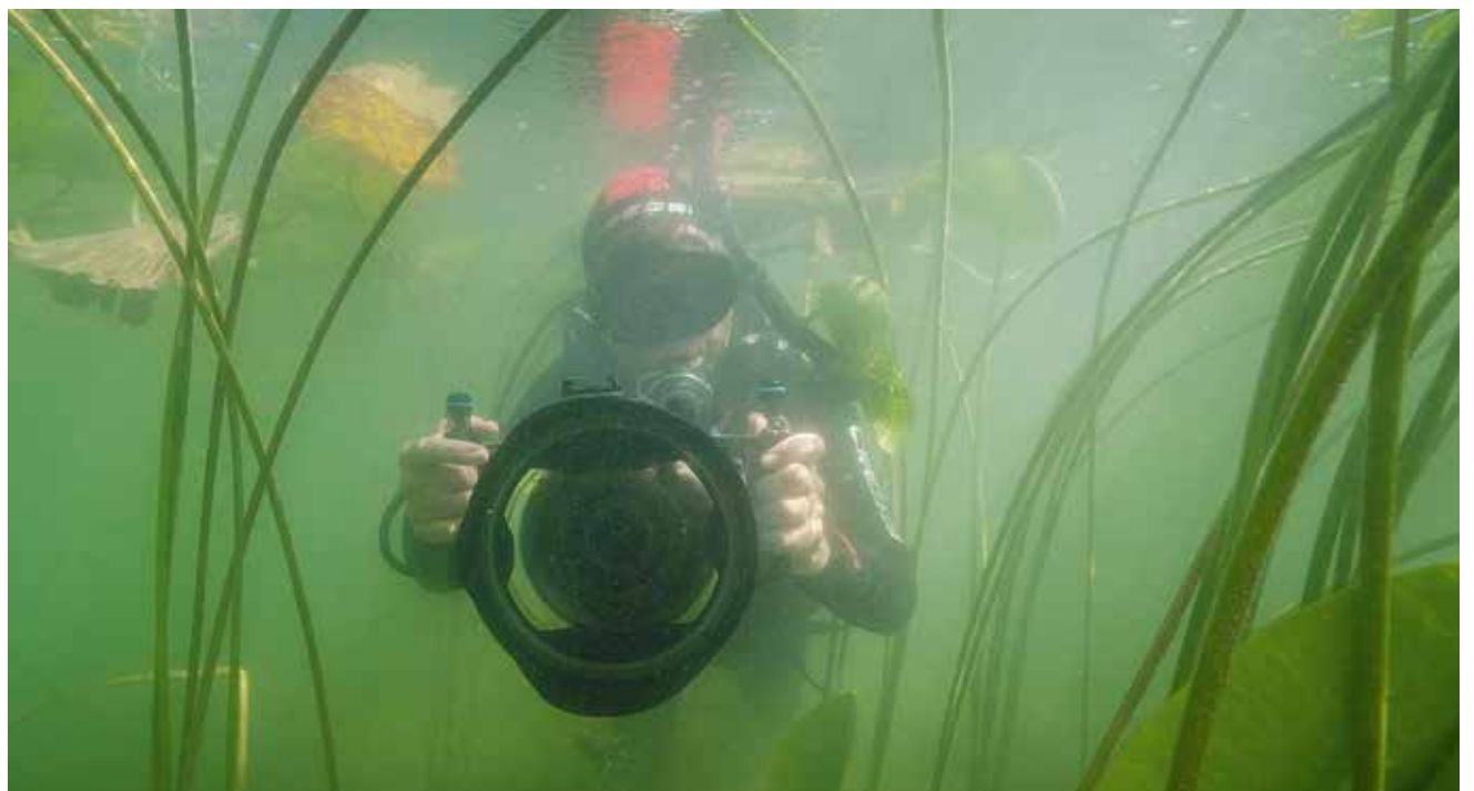
Michel Roggo est un spécialiste de la photographie lacustre sous-marine.

Si vous désirez nous faire part d'un événement qui se déroule au Val-de-Ruz, faites-nous parvenir vos informations détaillées par courriel à l'adresse redaction@valderuzinfo.ch . Le délai d'envoi des textes pour le numéro 319 (à paraître le 3 avril) est fixé au mardi 25 mars . Le libellé de l'annonce est du ressort de la rédaction. Les lotos, matches aux cartes, cours particuliers, ne sont pas référencés dans l'agenda. Pour ce genre de manifestations, il faut se référer à la rubrique petites annonces sur www.valderuzinfo.ch .